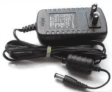
Adaptador de 12V.