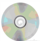
Disco de Instalacion