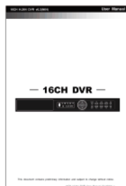
Guía Rápida de Operación